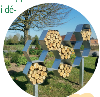
Abri à Osmies (abeilles solitaires)

La fauche tardive est un des points de cette gestion différenciée, permettant à un grand nombre de fleurs, d'invertébrés et d'oiseaux de se reproduire.