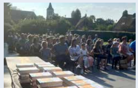
de nos jours...

42 – C'est le nombre de dictionnaires distribués aux élèves de CM2 du groupe scolaire Antoine de Saint Exupéry et de l'école Saint Joseph qui partent en 6 ème . Après cette cérémonie, les élèves de CM1 et CM2 ont pu participer à une boom organisée par le Conseil Municipal des Jeunes.