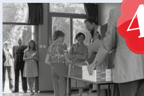
il y a quelques années ...