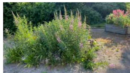
"Basilic" maintenant en 2023