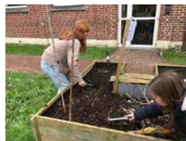
Bac "Coriandre" derrière la mairie