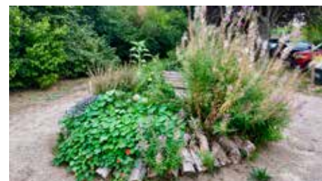
"Basilic" en 2022