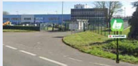
Station retour à 300 mètres du métro 4 Cantons (rue de Cysoing)

Aujourd'hui, en partenariat avec notre commune et l'association MicroStop, la MEL met en place une première expérimentation de ligne reliant les communes de Péronne-en-Mélantois, Bouvines et Sainghin-en-Mélantois au métro 4 Cantons.