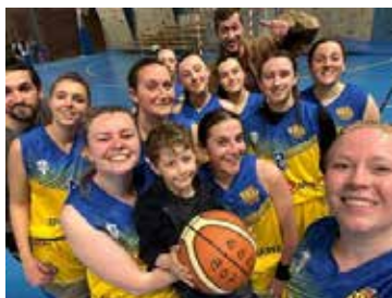
Seniors Filles lors de leur dernier match