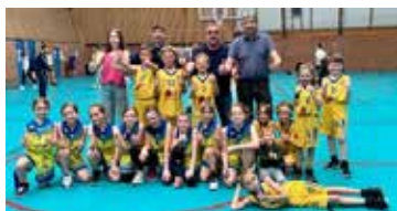
U9F et U9M lors d'une rencontre à Wattrelos

Le Cysoing Sainghin Bouvines a des équipes dans toutes les catégories d'âge en filles et en garçons. Les enfants profitent de leurs deux entraînements hebdomadaires pour découvrir et apprendre les techniques nécessaires à la pratique du basket. Des stages de perfectionnement