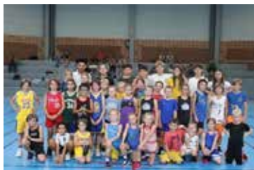
Les stagiaires et animateurs du Summer Camp

Un nouveau créneau horaire Basket Santé Seniors a été lancé à l'automne permettant à un autre public de découvrir cette activité