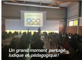
Un grand moment partagé, ludique et pédagogique!

secteurs : urbanisme, communication, finances, CCAS, etc.