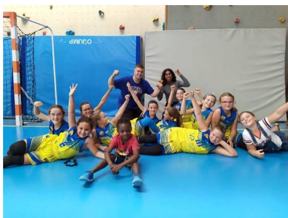
U11F A 2019/2020

Les filles ne sont pas en reste, les U18F étaient en tête de leur championnat ; les U11F A ont atteint le plus haut niveau district pour la première fois au club.