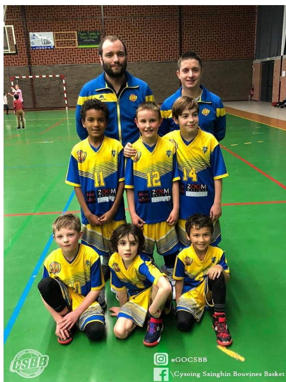
U11M B 2019/2020

Nos équipes de jeunes ne sont pas en reste, les U13M découvraient le niveau Régional et ont fait bonne figure toute la saison. Les U11M B après avoir connu une première phase d'apprentissage avait trouvé leur rythme de croisière lors du début de la deuxième phase.