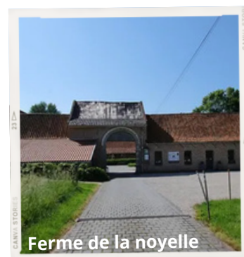
Ferme de la Noyelle